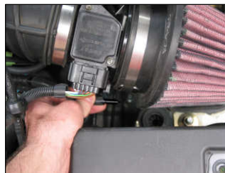
Fig. # 19