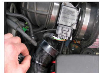
Fig. # 20