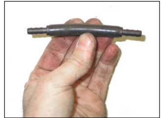
Fig. # 20