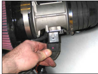
Fig. # 19