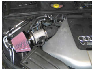
Fig. # 23